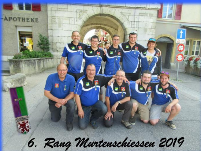
6. Rang Murtenschiesen 2019